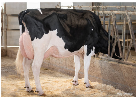
PROGENESIS HIGHJUMP LEADER DAM